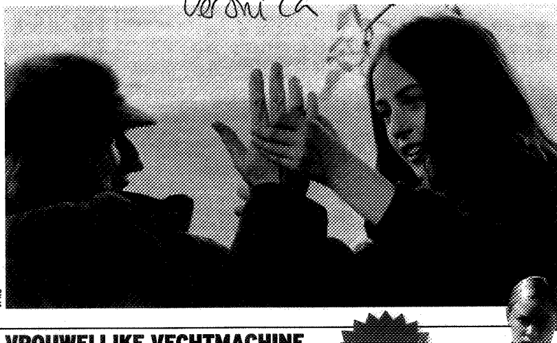
VPRO VROUWELIJKE VECHTMACHINE

TV | Holland Doc: Gevaarlijke dromen | Nederland 2 | 22.50